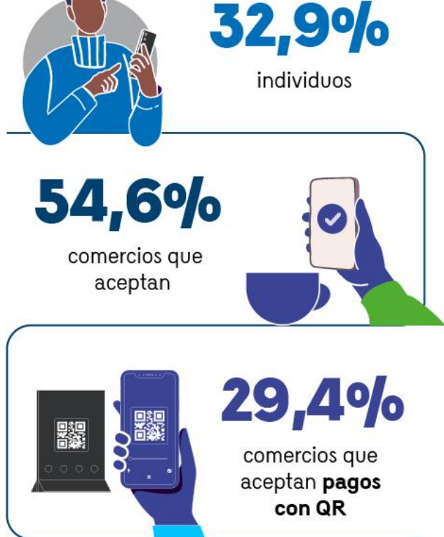
Percepciones sobre los pagos electrónicos