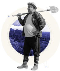
Fases del concurso Primera fase

Todos los equipos que deseen participar con sus ensayos deberán inscribirse en el formulario de inscripción del concurso antes de la fecha límite establecida. Allí deberán compartir el enlace donde se encuentra alojado su ensayo.