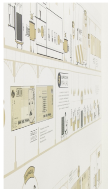
| MEDELLÍN |