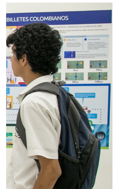
| SANTA MARTA |