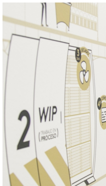
| CALI |