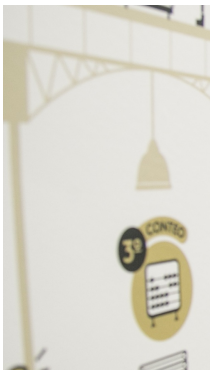
| BOGOTÁ |

¡Anímate a vivir esta experiencia única, elige la ciudad y planea la visita de tus estudiantes!