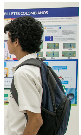
| SANTA MARTA |