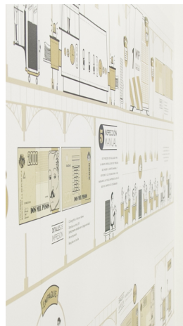
| MEDELLÍN |