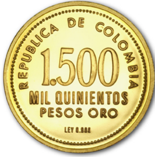
Moneda conmemorativa de oro del cincuentenario del Banco de la República