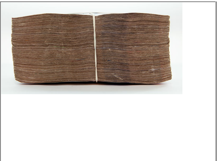
Conformación incorrecta de fajo de 500 billetes