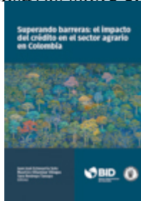
Título: Superando barreras: el impacto del crédito en

el sector agrario en Colombia ISBN 9789586643856 Año de publicación 2018