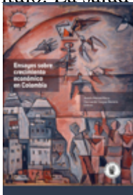
Título: Ensayos sobre crecimiento económico en Colombia ISBN