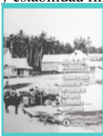
9789586643146 Año de publicación 2015