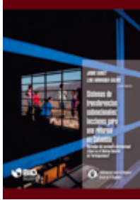
9789586643443 Año de publicación 2016