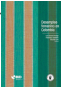
9789586643399 Año de publicación 2016