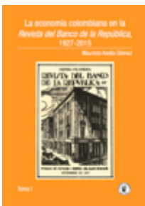
Título: La economía colombiana en la Revista del Banco de la República, 1927-2015 ISBN