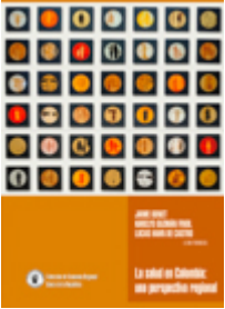
Título: La salud en Colombia: una perspectiva regional ISBN 9789586643573 Año de