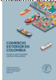
Título: Comercio exterior en

Grande Caribe ISBN 9789586643979 Año de publicación 2019