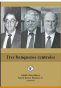
Título: Tres banqueros centrales ISBN 9789586643672 Año de publicación 2017