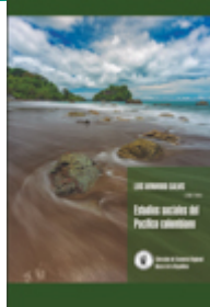
9789586643429 Año de publicación 2016