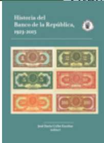
ISBN 9789586643740 Año de publicación 2017