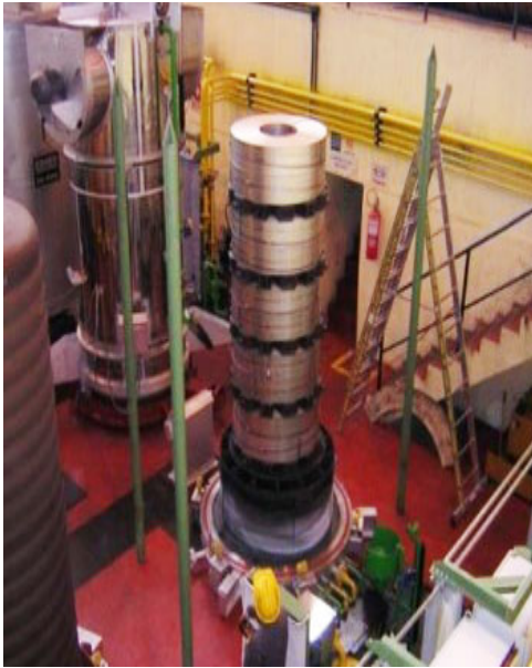
Hornos de recocido de fleje Ebner.