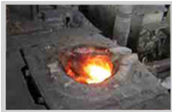
Horno de fundición