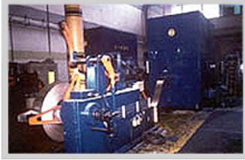
Punzonadora marca Linde