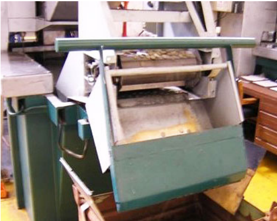
Horno de recocido de cospel Trómell.