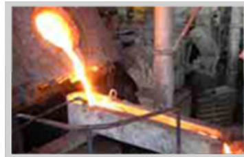
Horno de fundición