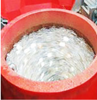
Máquina Spaleck de lavado.