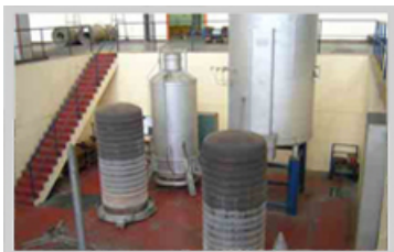
Hornos de recocido de fleje Ebner