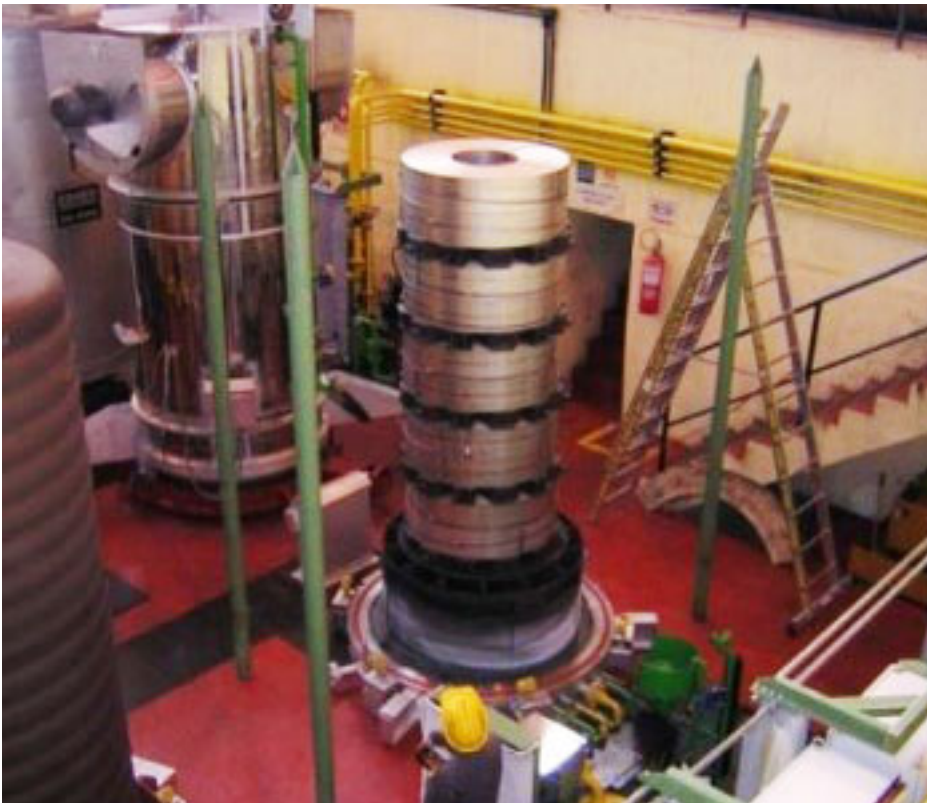
Hornos de recocido de fleje Ebner.