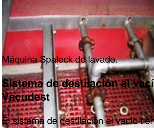
Máquina Spaleck de lavado.