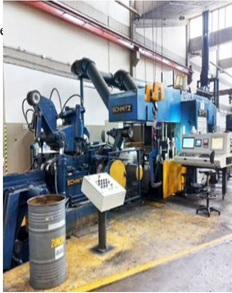
Laminador Schmitz. Sistema reversible de laminación en frío.