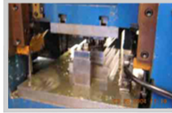
Punzonadora marca Linde