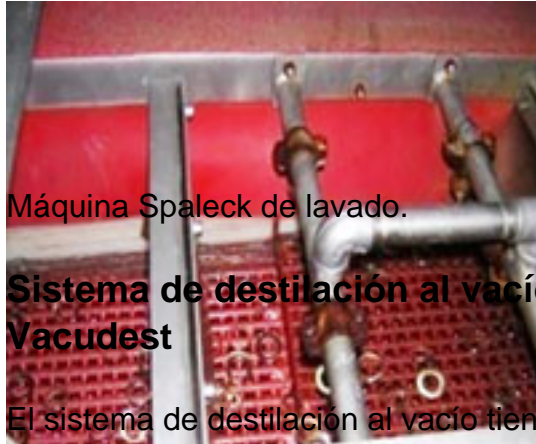
Máquina Spaleck de lavado.