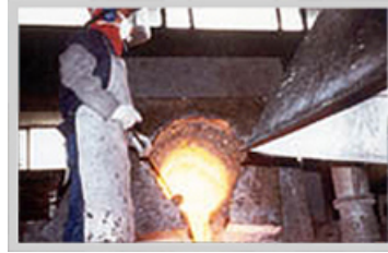
Horno de fundición