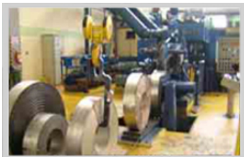
Laminador Schmitz. Sistema reversible de laminación en frío.