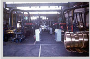
Planta de fundición

Con aleaciones de proporciones precisas y temperaturas controladas se obtienen piezas con la dureza y el brillo que requiere toda la cadena de producción. Los estrictos controles metalúrgicos, garantizan la pureza de las aleaciones o la utilización económica de todos los recursos.