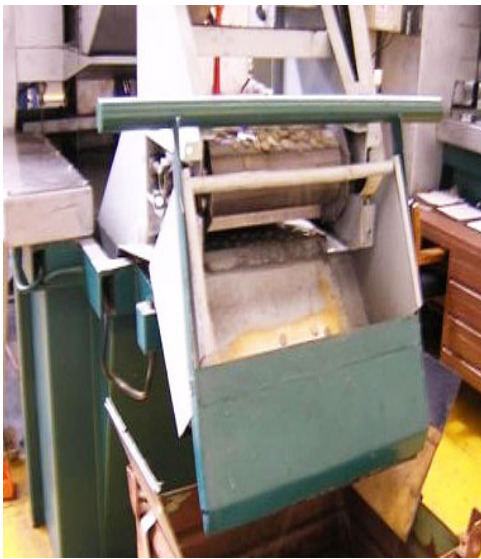
Horno de recocido de cospel Tró mell.