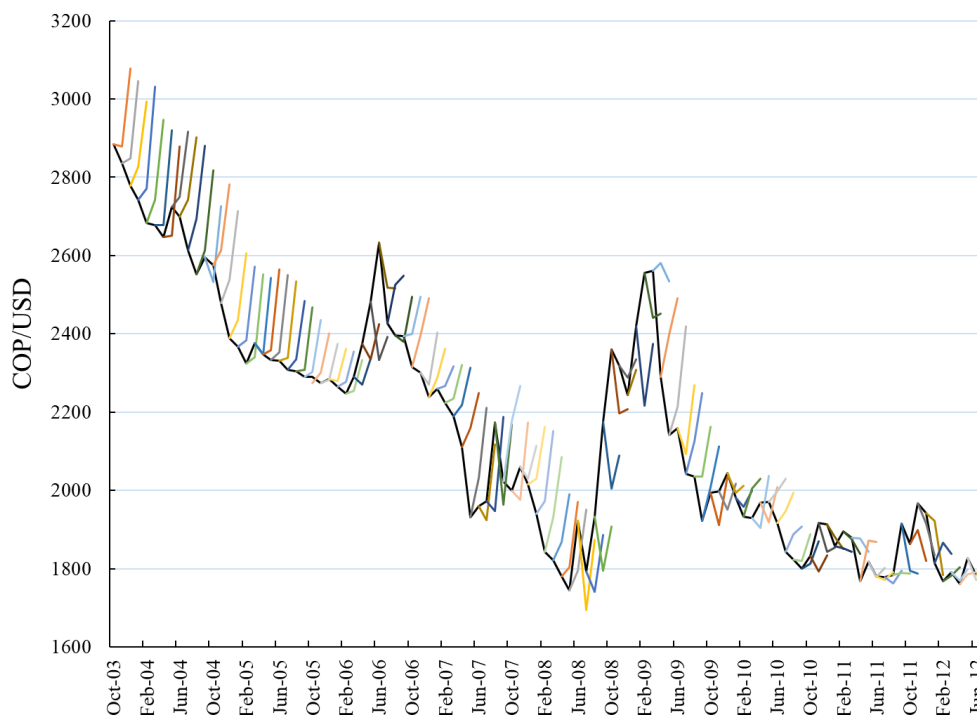
Gráfico 6.1. Tasa de cambio en Colombia y expectativas a 1 año

El Gráfico 6.1 muestra cómo la respuesta promedio (líneas cortas de colores sobre el segmento largo para mostrar lo que se esperaba a un año) no solo era muy superior al valor de la tasa de cambio del momento, sino aun mayor a lo que resultó un año después. Este comportamiento pareciera haberse corregido a partir del 2010.