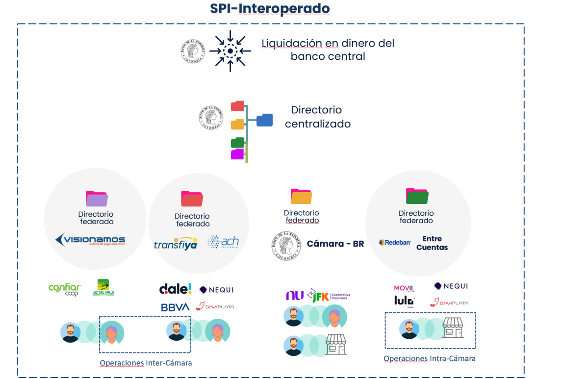
Gráfico 1. Arquitectura del SPI - Interoperado

tecnológica que proveerá el Banco como parte del SPI-Interoperado. Los otros dos componentes son el directorio centralizado, que se encuentra un nivel más arriba en el gráfico, y que facilitará la identificación de usuarios entre las diferentes cámaras, habilitando así la interoperabilidad; y, por último, el módulo operativo de liquidación centralizada, ubicado en la parte superior, que permitirá la liquidación bruta en tiempo real de todas las transacciones que involucren alguna cámara del ecosistema.